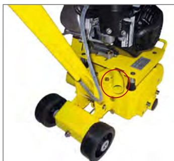
Saída do aspirador